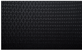
Tela negra - versiones GLX

Toda la información contenida en este material está basada en datos disponibles al momento de su publicación. Las descripciones son correctas, Mitsubishi Motors de México, S.A. de C.V. se esfuerza por mantener la precisión, sin embargo, la exactitud no puede garantizarse. De vez en cuando, Mitsubishi Motors de México, S.A. de C.V. necesita actualizar o modificar las características e información del vehículo ya mostradas en esta ficha técnica. Algunos vehículos presentados incluyen equipamientos opcionales que pueden no estar disponibles en algunas regiones. Todas las fotos y las pantallas son de carácter ilustrativo y de referencia. Mitsubishi Motors de México, S.A. de C.V. por medio de la publicación y distribución de este material no crea garantía, expresa o implícita, en relación a cualquiera de los productos de Mitsubishi Motors. Contacta a tu Distribuidor más cercano para obtener la información más actualizada. Garantía Defensa a Defensa: 7 años sin kilometraje limitado. Consulta términos y condiciones en www.mitsubishi-motors.mx . Este vehículo contiene los dispositivos de seguridad obligatorios de conformidad con la NOM-194-SE-2021.