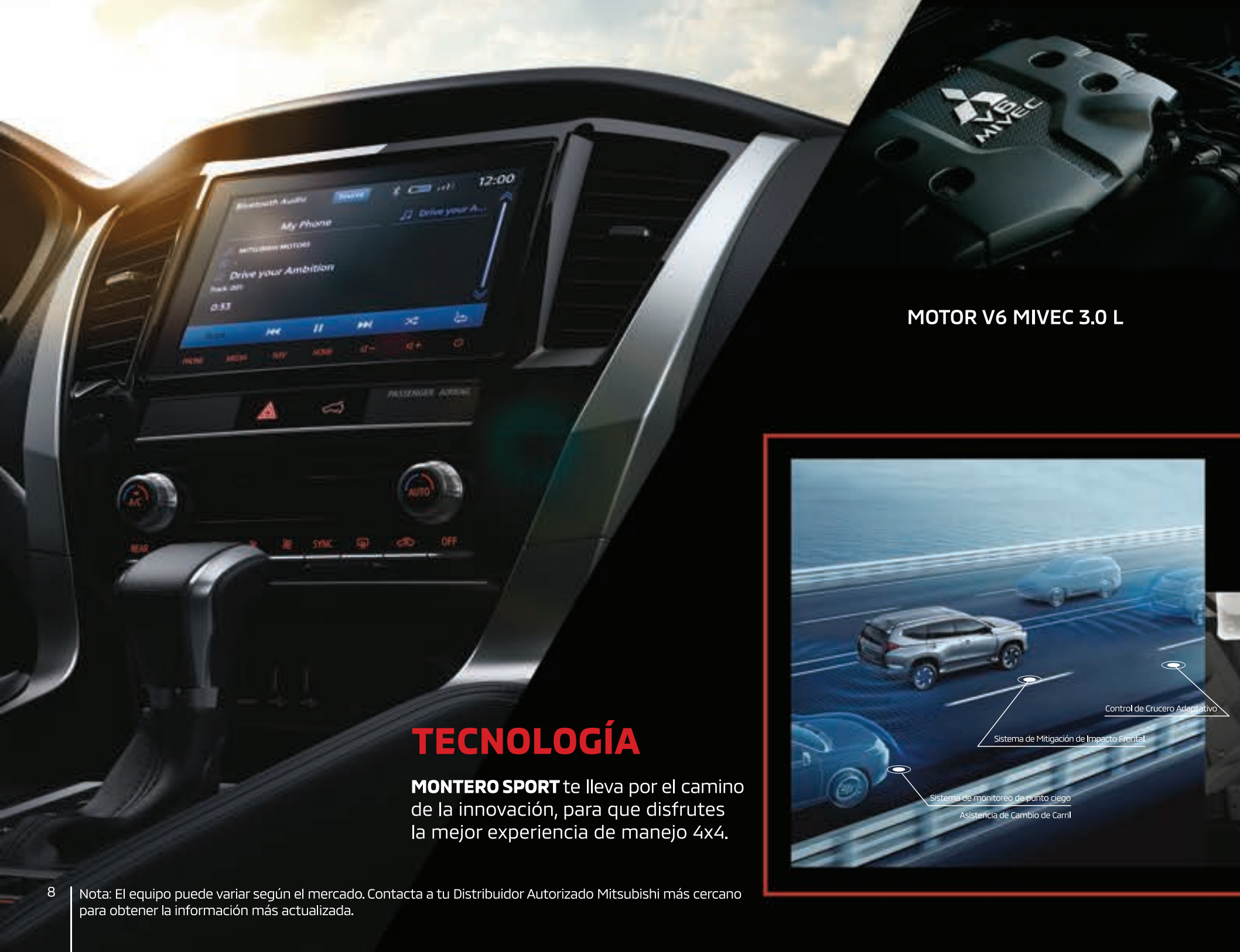
MOTOR V6 MIVEC 3.0 L