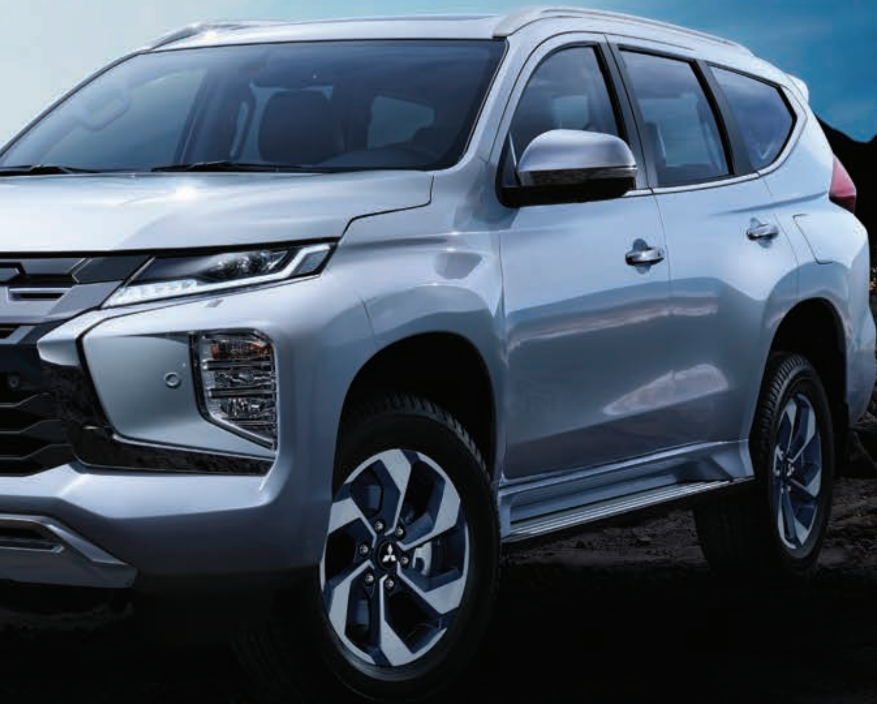
MONTERO SPORT SE PLUS Color Blade Silver Metallic

Nota: El equipo puede variar según el mercado. Contacta a tu Distribuidor Autorizado Mitsubishi más cercano para obtener la información más actualizada.