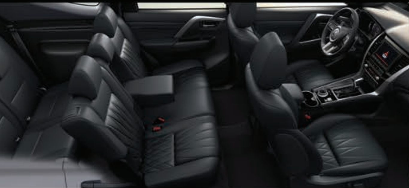
TRES FILAS DE ASIENTOS